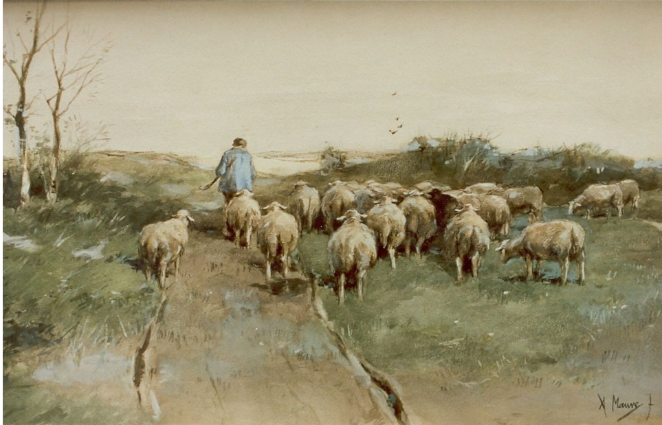
Anton Mauve: Herder met zijn kudde schapen