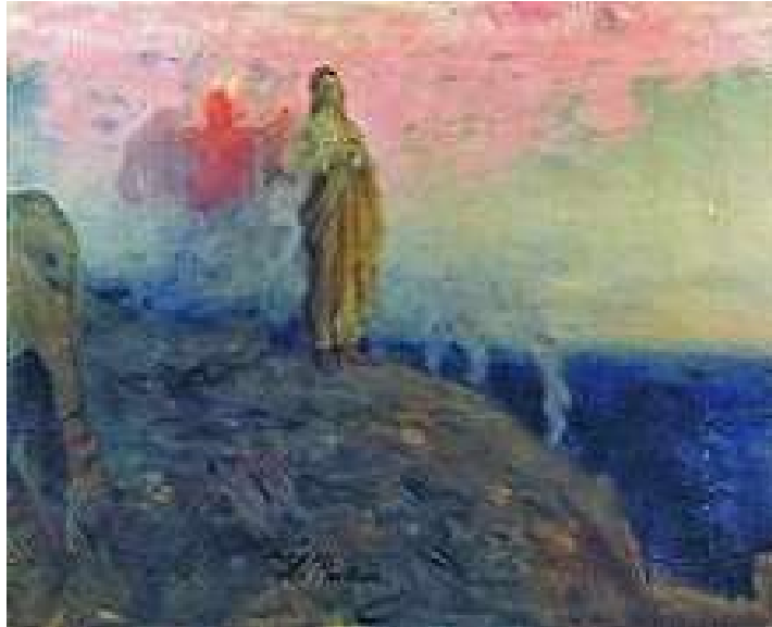
'Verzoeking in de woestijn' Ijla Repin