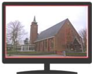
Bethelkerk kerk-tv Vlaardingen

Na afloop is er gelegenheid elkaar te ontmoeten bij een kopje koffie.