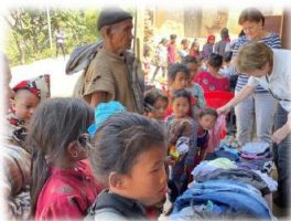
Aan ruim 80 gezinnen kleding uitgedeeld die dit niet kunnen permiteren