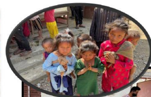
Gratis medische hulp aan meer dan 90 gezinnen die door armoede geen toegang daartoe hebben