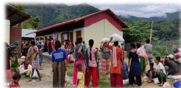
Voedsel gedistribueerd aan 400 gezinnen die tijdens Covid 3 maanden nagenoeg geen eten hadden