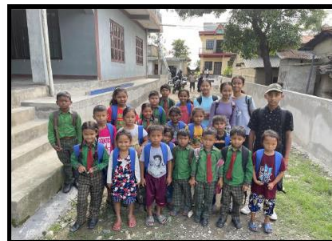
Huisvesting, kleding en educatie aan 25 kinderen die (deels) verweesd zijn