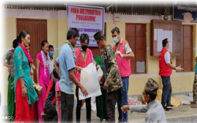
Voedselprogramma voor 50 gezinnen die in armoede leven