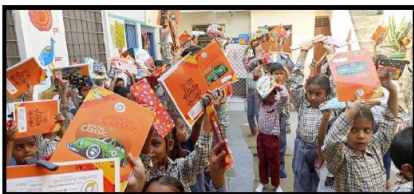
Schoolspullen uitgedeeld aan 82 kinderen waarvan de ouders in extreme armoede leven