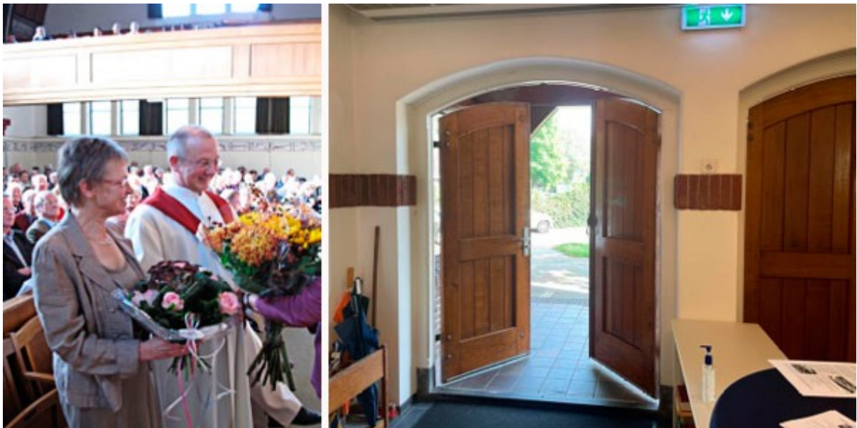
Links: Een foto van de intrededienst in de toenmalige Oosterkerk

Het was een feestelijk afscheid! Vrijdag avond begon met een persoonlijke voorstelling van Kees Posthumus.